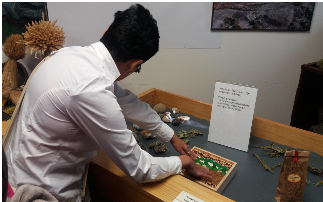
haptická výstava Tajemství symbiózy v Botanické zahradě Praha