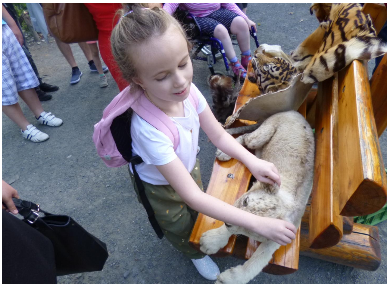
Noc snů v ZOO