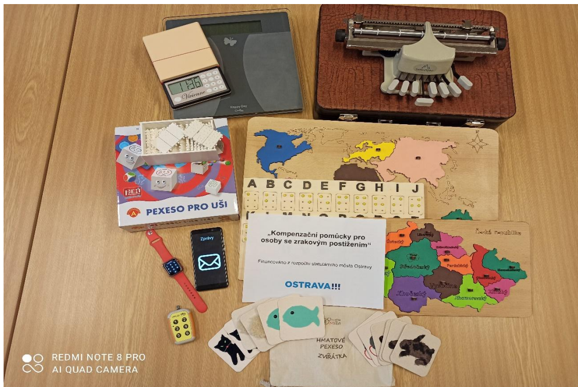
projekt „Kompenzační pomůcky pro osoby se zrakovým postižením“