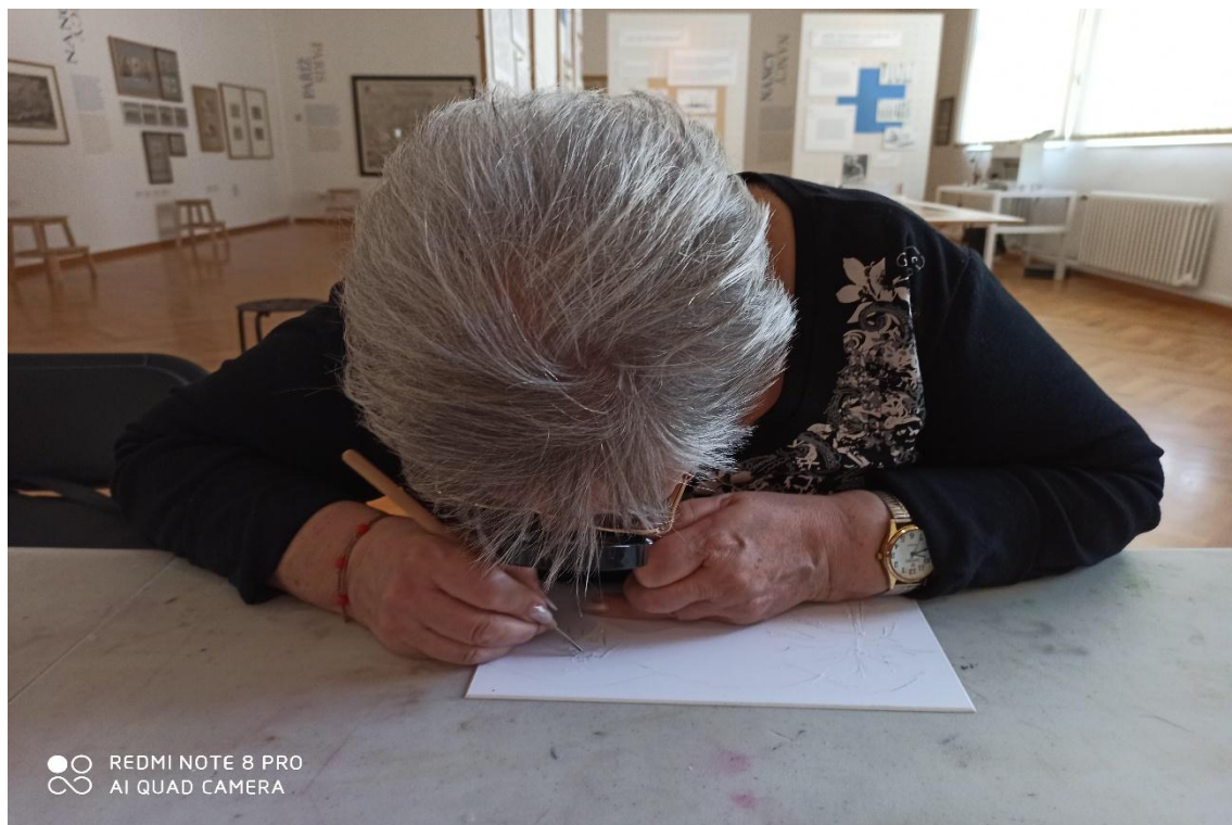
výtvarné tvoření v GVUO – workshop k výstavě Zrcadlo světa