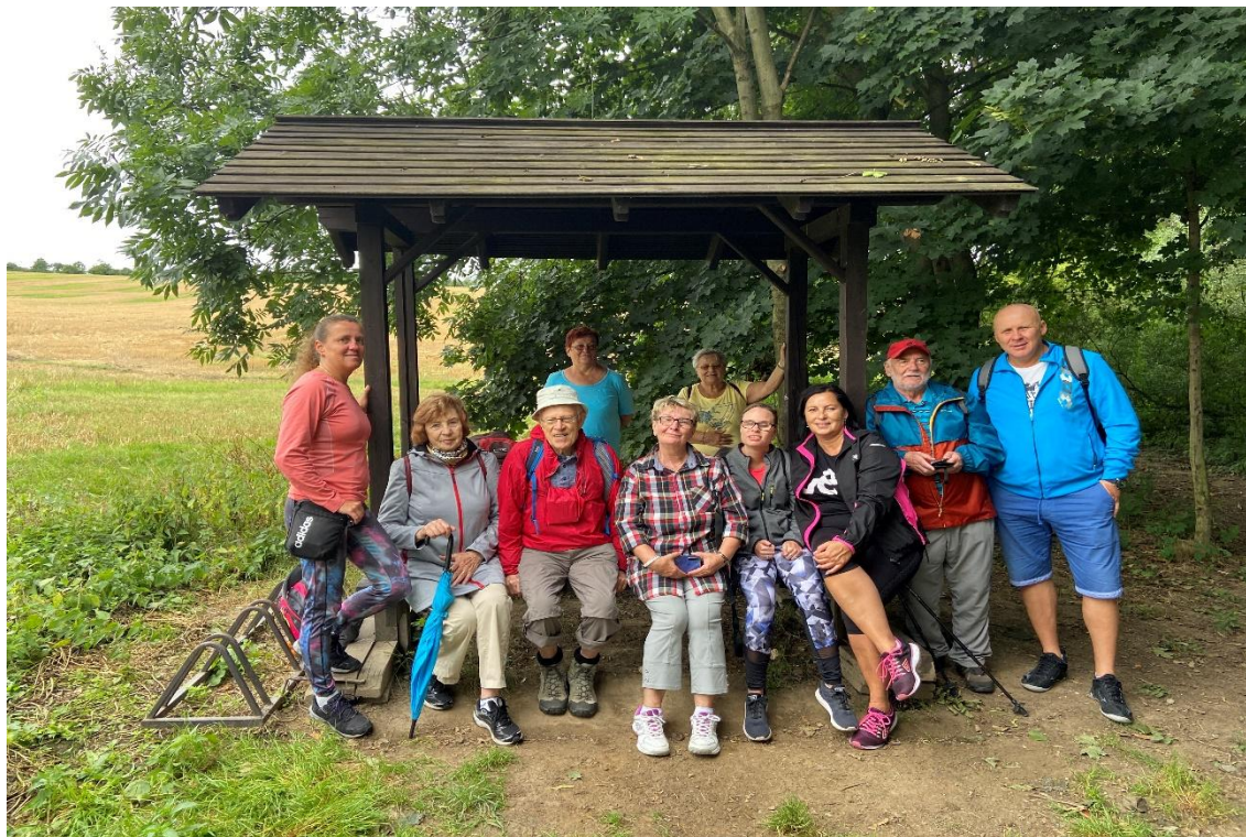
turistický klub – rozhledna Kanihůra