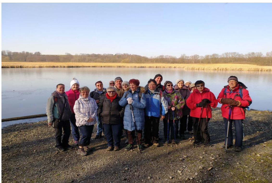
turistický klub – z Martinova do Hlučína