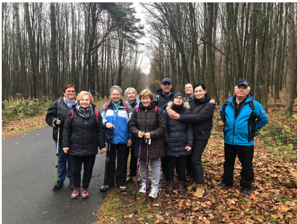
turistický klub – závěrečná do Šilheřovic