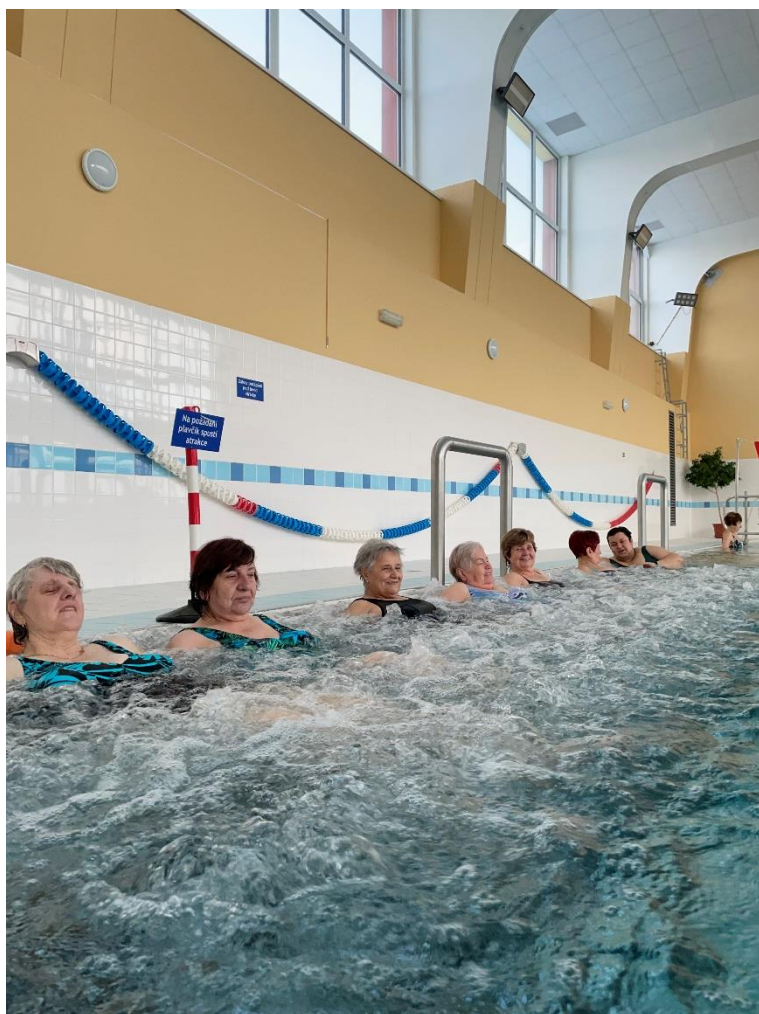
projekt „Plavání pro osoby se zrakovým postižením“