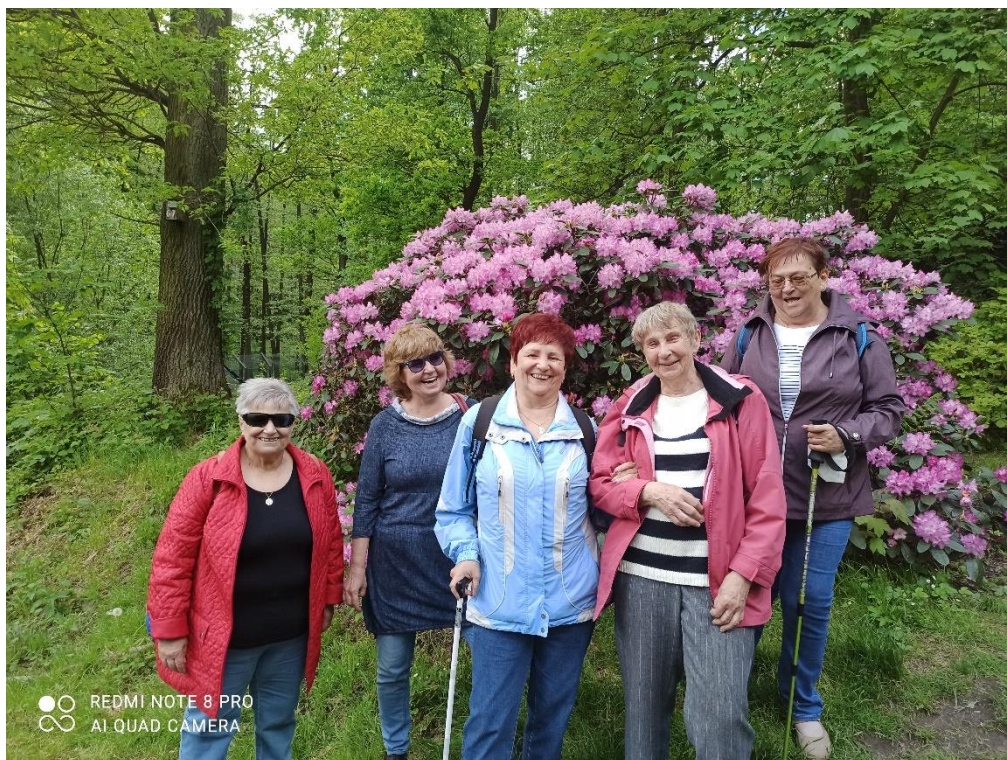
Botanický park Ostrava – komentovaná prohlídka Rododendron parku