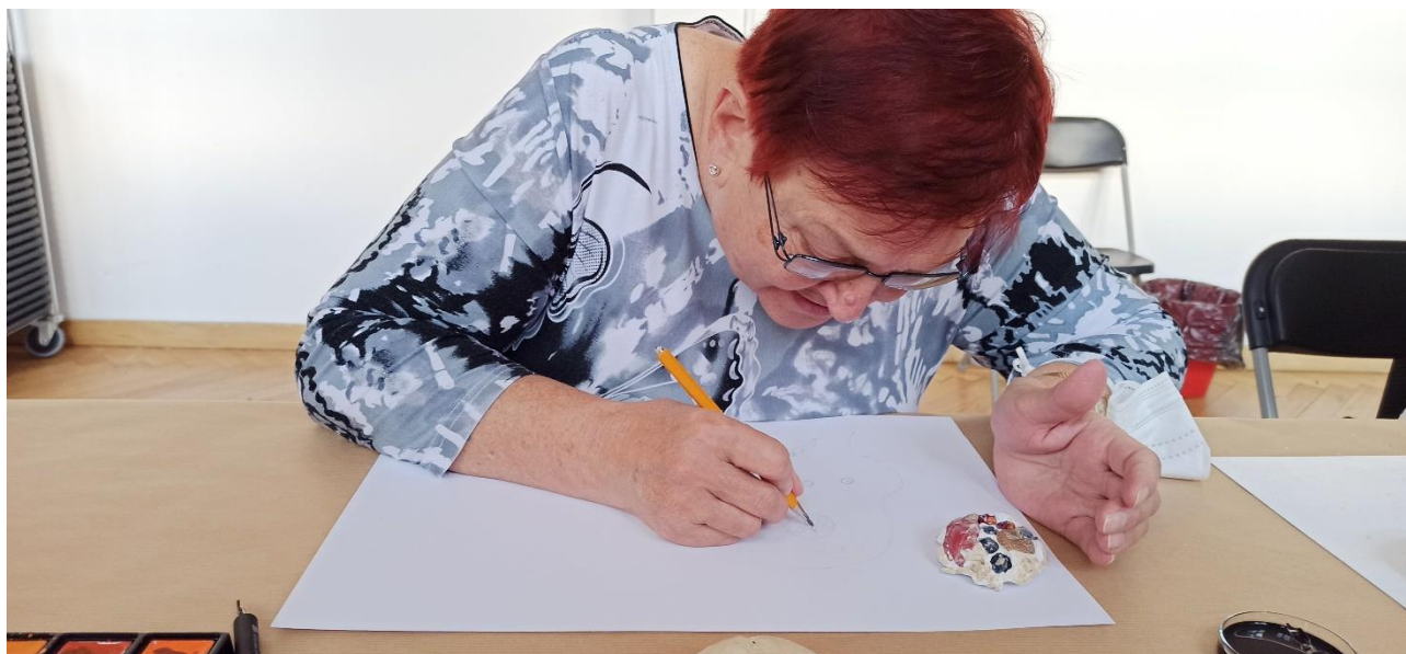
výtvarné tvoření v GVUO