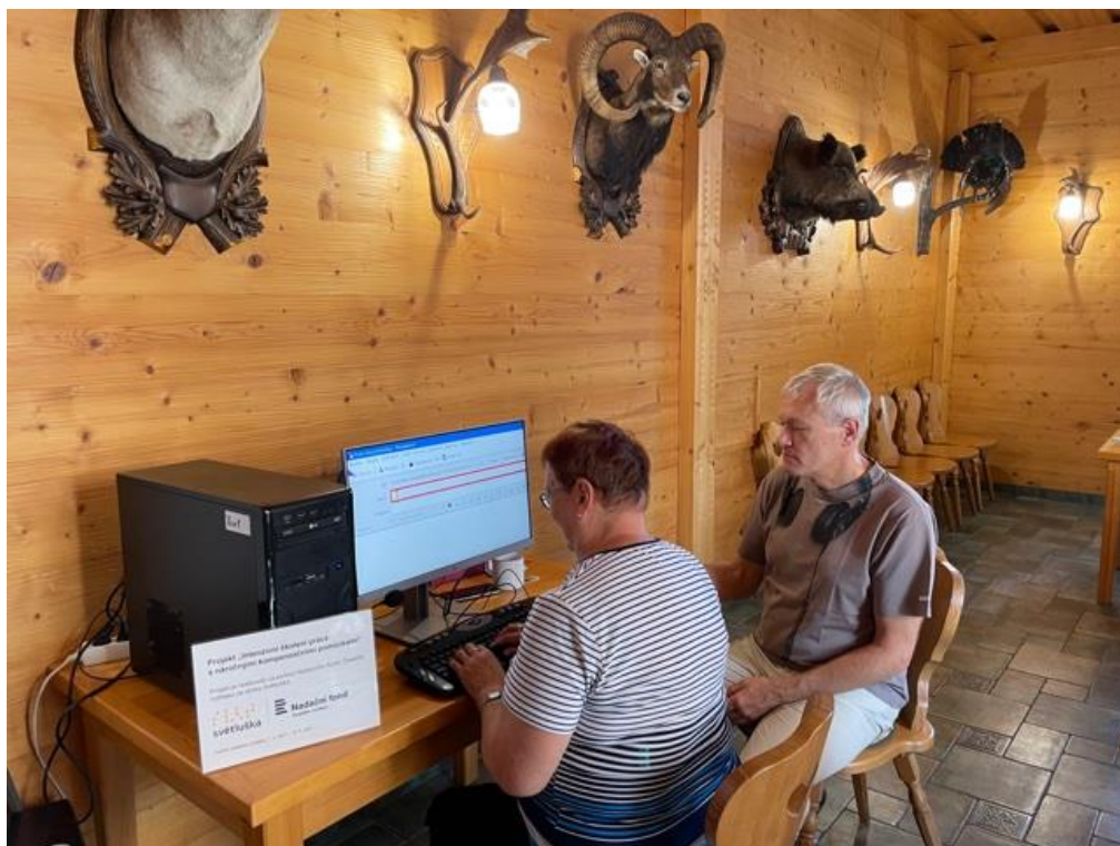
projekt „Intenzivní školení práce s náročnými kompenzačními pomůckami“