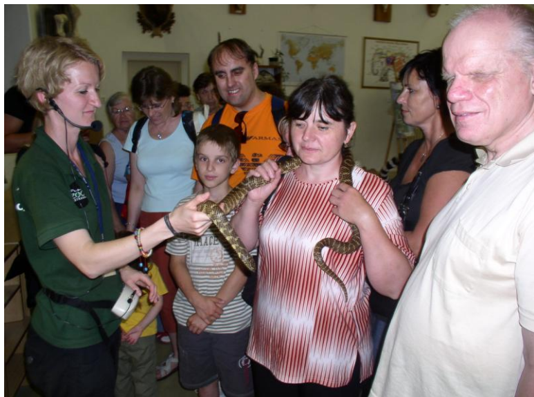
Komentovaná návštěva ZOO Ostrava