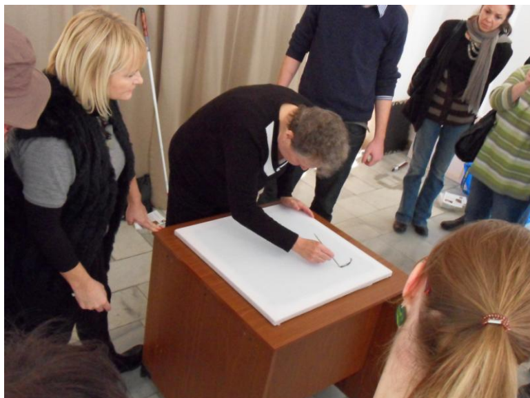
Haptická malba v GVUO

Základní a odborné sociální poradenství zahrnuje celou řadu informačních, poradenských a intervenčních činností, ale také služeb zprostředkování a činností přímé pomoci. Tyto služby jsou poskytovány převážně individuálně.