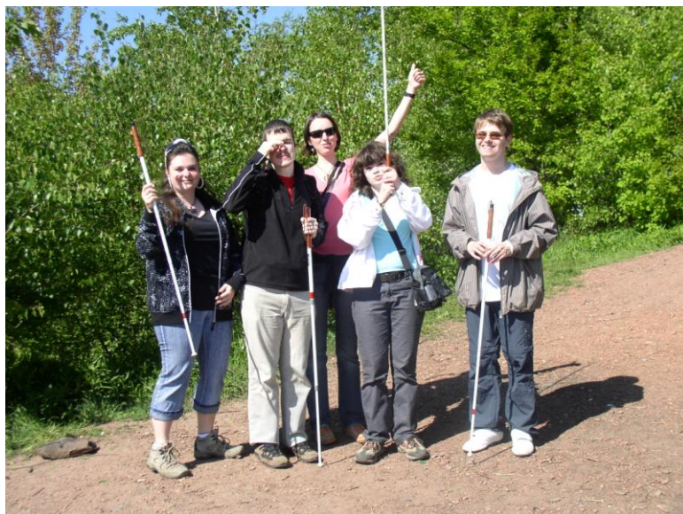
Sportovně relaxační odpoledne

Součástí služeb je i digitalizace textových materiálů a tisk v bodovém písmu.