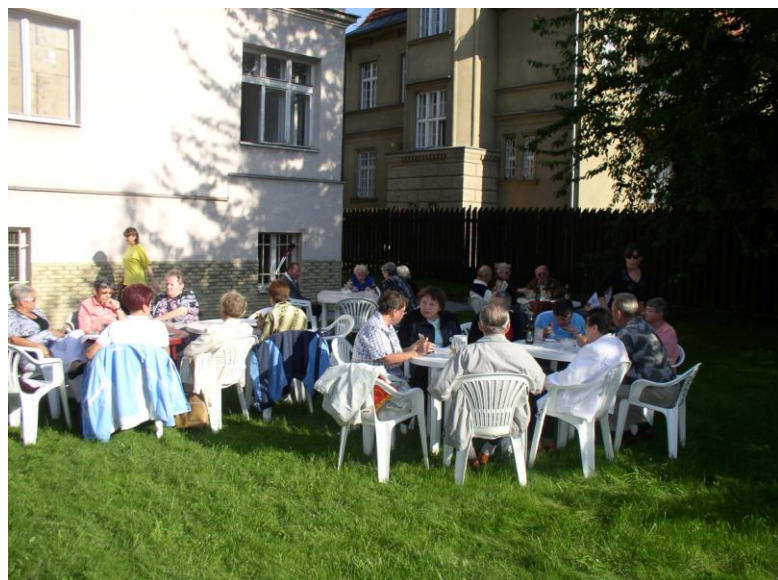
Loučení s létem