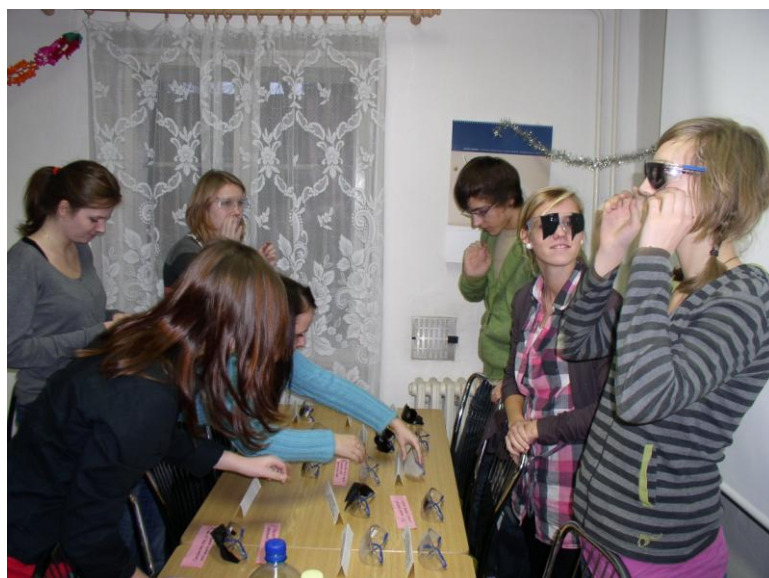
Beseda se studenty Střední zdravotnické školy