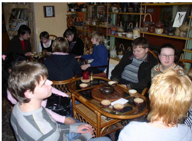
Sportovně relaxační odpoledne – návštěva čajovny

V TyfloCentru si uživatelé mohou osvojit nebo prohloubit znalosti a dovednosti nezbytné pro samostatný život s těžkým zrakovým postižením, např. v oblasti sociálního kontaktu nebo práce s náročnými elektronickými kompenzačními pomůckami. Tyto dovednosti jim pomohou žít ve větší míře samostatně a nezávisle na pomoci jiných osob, zvýší jejich sebedůvěru a podpoří jejich vzdělávání, přípravu na rekvalifikaci, vlastní pracovní i společenské uplatnění.